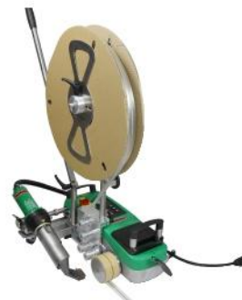
Zestaw do taśmy